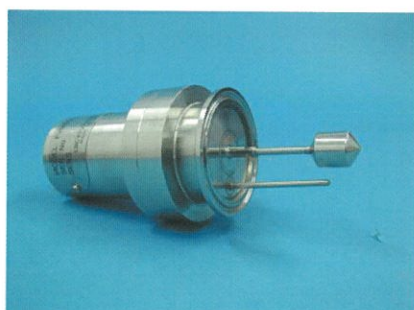
2Sフェルールプローブ