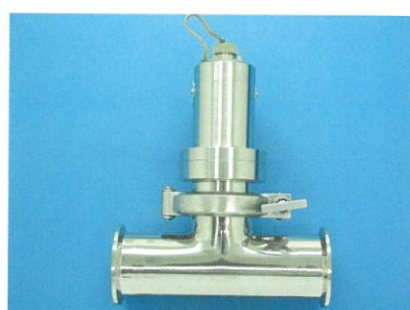
2Sサニタリーチーズ管