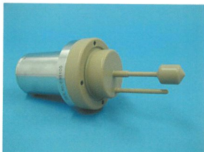
テフロンコーティング